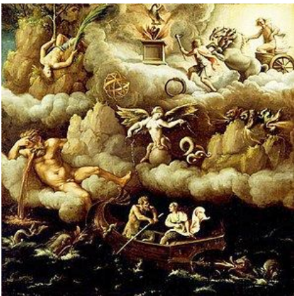
Аллегория Бессмертия (Джулио Романо) – Всё от Воды.

Но такую структуру вода имеет не всегда. Причины появления многих функциональных нарушений в организме человека и ряда экологических проблем - в структуре воды, которую мы используем. Если бы удалось в одночасье изменить её структуру (как она меняется под действием «пирамиды») в окружающем нас пространстве (а человек на 80% состоит из воды), то эффект превзошел бы всяческие ожидания. Это и есть бессмертие.