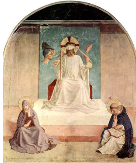
1. «Лазарь! выйди вон» (Ион.11:43) (Карл Блох, 1891). 2. «Прореки, кто тебя ударил,» (Мр.14:65) (Грюневальд Маттиас, 1510, последний великий художник Северной Готики).