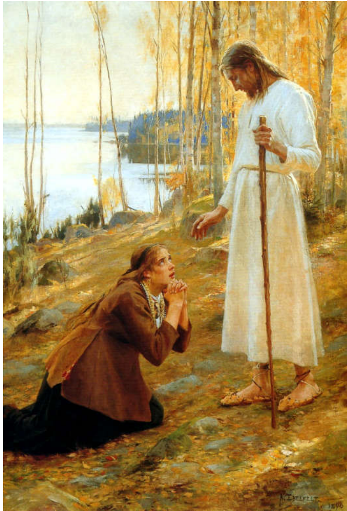
Христос - Наш