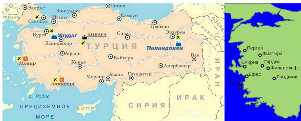
Карта современной Турции и карта 7 Апокалипсических Церквей.

Фиатиря всегда была местом для всех. Рядом была Троя, Сирия. И была под Александром Македонским, была и частью Римской Империи, и Византией. И только с 13 века стала Османской Империей, а затем с 1922 года и Турцией.