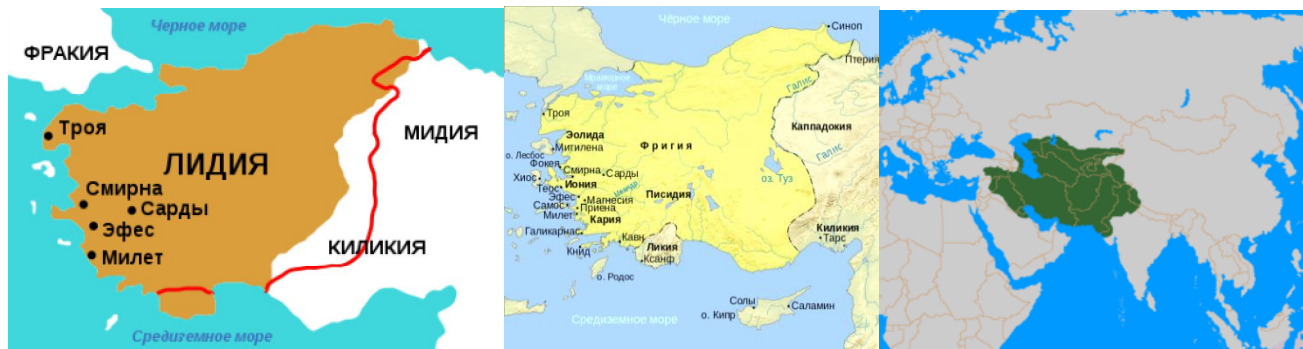
1. Лидия при Крезе. 2. Лидия при Кире или Фракия (Тракия). 3. Завоевания Тимура.

Тимур известен своим разгромом Золотой Арды, сжег её столицу Сарай, этим принес пользу Русским в борьбе против Татаро-Монгольского ига. Воевал с Грузинским царем (1394г.) за Исламизацию страны. Побывал в Поволжье, на Дону. Попробовал взять Москву, но это не допустила Владимирская Икона Божьей Матери. Разгромил колонии Итальянских купцов в Крыму, сжег Азов, Феодосию и Астрахань. Его Индийский поход принес ему огромную добычу, которую оставил в своей столице, Самарканде. Разгромил единое ему Османское государство. Попробовал в 1404 году поход на Китай, но в 1405 скончался.